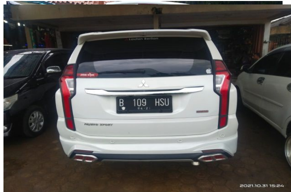
Keterangan : Eksterior Belakang