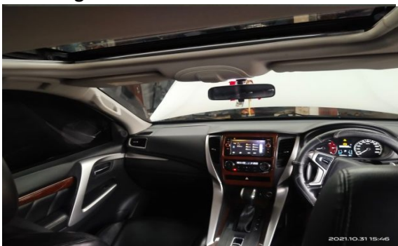
Keterangan : Dashboard