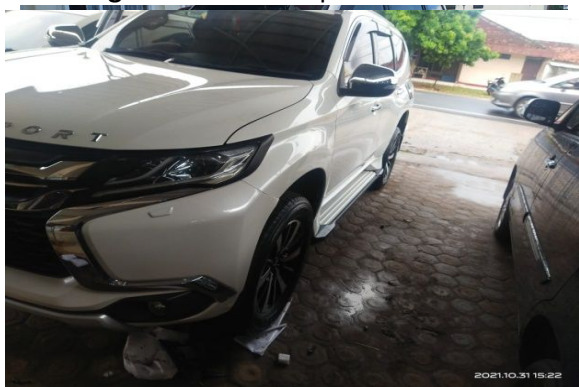
Keterangan : Eksterior Depan