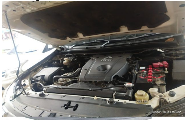
Keterangan : Mesin