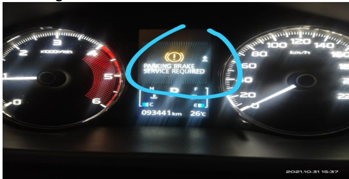
Keterangan : Kilometer